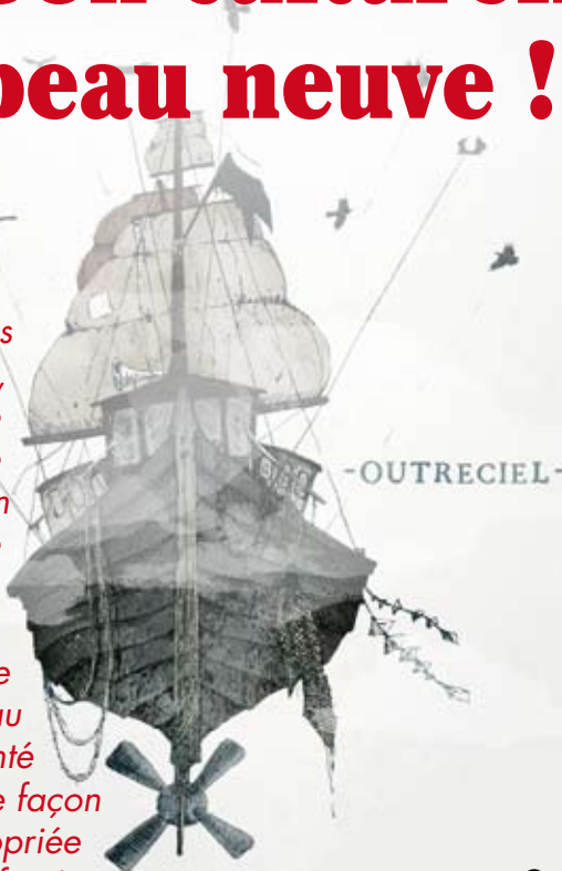
Outreciel, spectacle de La Valise prévu en avril 2014

Après 15 ans d'existence, la saison culturelle de la Communauté de communes Billom Saint-Dier - Vallée du Jauron se renouvelle et s'apprête à prendre un nouveau tournant : une volonté de répondre de façon plus appropriée aux spécificités du nouveau territoire élargi.