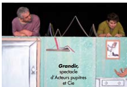
Grandir, spectacle d'Acteurs pupitres et Cie

Son fonctionnement : une carte d'abonnement à une bibliothèque du réseau permet l'accessibilité aux 4 bibliothèques du réseau existant. Le site www.reseaubib-valleejauron.fr donne accès à un catalogue en ligne pour toute recherche de documents. Suite à la fusion des 2 Communautés de communes en janvier 2013, la compétence lecture publique est étendue à tout le territoire. Un travail d'état des lieux est en cours pour une extension du réseau.