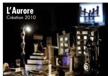
Production «Scènes d'hiver sur un coin de table». Reconstitution méca-manipulée du tournage du film.

En février , un comédien de La Valise interviendra dans les établissements scolaires avec le spectacle L'Aurore , une représentation tout public aura lieu samedi 22 février au Centre d'ailleurs à Saint-Jean-des-Ollières.