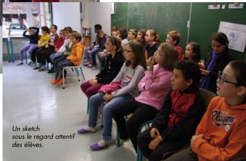
Un sketch sous le regard attentif des élèves.

Ces mêmes enfants ont assisté à la fin de résidence de L'enfant cosmonaute , les comédiens leur ont présenté des petits sketches, des idées qui pourraient être retenues pour le spectacle. Cette nouvelle création sera travaillée encore pendant plusieurs mois et prendra sa forme finale en septembre avec une présentation tout public à Billom.